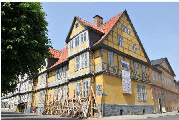
Kloster zur Ehre Gottes, Klosterstraße 2

Bitte geben Sie bei Ihrer Anmeldung Ihre Kontaktdaten wie Adresse, Telefon und E-Mail an.